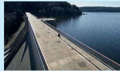
Staumauerkrone der Talsperre Eibenstock – Sachsens größter Wasserspeicher.