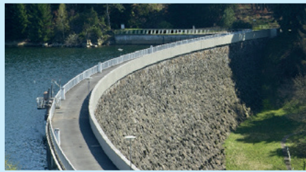
Die gekrümmte Gewichtsstaumauer der Talsperre Saldenbach ist begehbar.