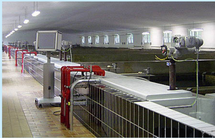
Die modernen Anlagen des Wasserwerks Einsiedel sichern die Trinkwasserversorgung der Region Chemnitz.

Der Staat unterstützt den Wasserpreis nicht durch Subventionen, stellt jedoch durch die Trinkwasserverordnung hohe Anforderungen an die Qualität des Wassers. Und schließlich führen hohe Unterhaltskosten der Wasserwerke und unseres modernen Wasserversorgungssystems zu einem Fixkostenanteil von ca. 80 % in der Trinkwasserbereitstellung. Diese Kosten fallen unabhängig von der abgegebenen Wassermenge an.