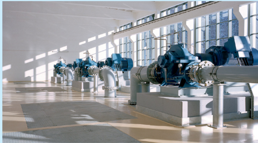
Wo das natürliche Gefälle nicht ausreicht, gelangt das Wassers mithilfe eines Pumpwerks an seinen Bestimmungsort.